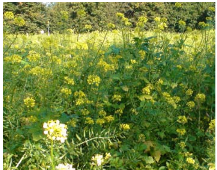
Een impressie van het mosterdgrasveld. Het gewas is al 1.5 meter hoog.

Op de vraag waarom het mosterdgras er toch staat, antwoordde de schepenen dat 'een buurtbewoner waarschijnlijk het mosterdgras 's nachts heeft gezaaid'. Het waren dus de kabouters. Hallucinant!