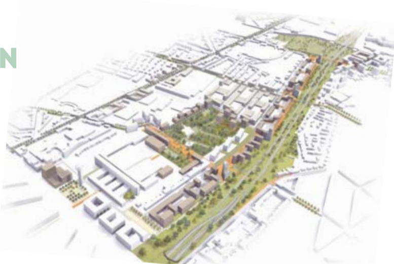
De E40 in Schaarbeek anno 2015

Gelukkig is het plan nog maar een denkpiste.