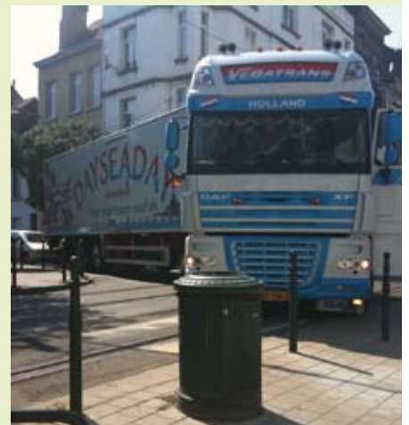
Juli 2009: Vrachtwagen rijdt zich klem op de hoek van de Prinses Clementinastraat en de Stefaniastraat in Laken.