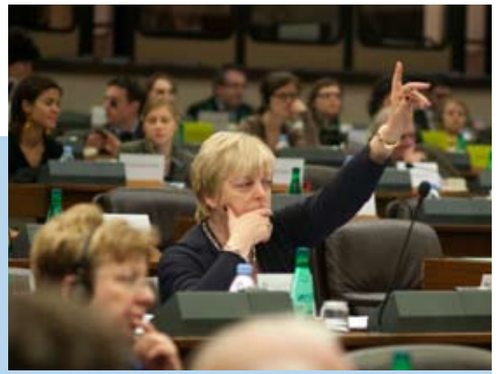
Annemie Neyts zet haar Europees werk verder

Een recente studie van professoren Swyngedouw en Corijn stelt dat de Europese instellingen (Commissie, Parlement, Raad van Ministers, Comité van de Regio's) tussen 38.000 en 41.000 arbeidsplaatsen creëren en bijna 4.000 voor de NAVO. Daarbij voegen we alle parallelle activiteiten (15-20.000 lobbyisten, 1.400 journalisten, 300 regionale vertegenwoordigingen, 5.322 diplomaten, 2.500 andere internationale agentschappen, meer dan 2.000 internationale ondernemingen, 150 internationale advocatenbureaus, ...). In totaal genereren de Europese en internationale instellingen in Brussel 13 tot 14% van de Brusselse werkgelegenheid en economie.