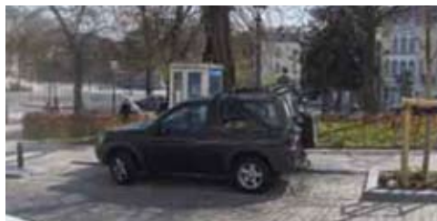
Te veel plaats voor 1 wagen, te weinig voor 2