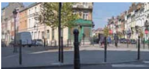
Een bos van paaltjes? Liever een bos bloemen!

Wil u reageren of denkt u een oplossing te kennen? Mail naar tine.bigare@vldbrussel.be