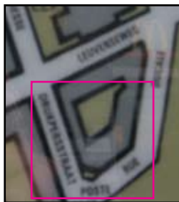
'Het Vlaams Parlement blijkt nog niet te bestaan...'