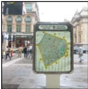
Het bewuste bord aan de Beurs.

Op de plaats waar nu het Brussels Parlement gehuisvest is, vindt men volgens de plattegrond "het Voorlopig Bewind". Ondertussen werden er in het centrum van Brussel nog meer van deze verouderde kaarten gespot. Gemeenteraadslid Els Ampe zal vragen de borden aan te passen.