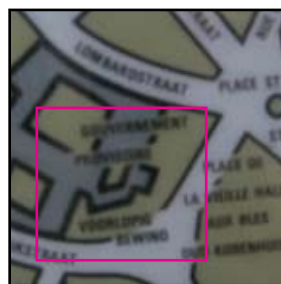
'Het Voorlopig Bewind alias het Brussels Parlement'