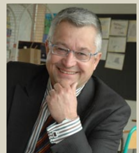
Guy VANHENDEL Brussels Minister

Vanhengel is niet aan zijn proefstuk toe, want hij heeft al heel wat belastingverminderingen doorgevoerd: zo heeft hij bijvoorbeeld al 2 keer de registratierechten op de aankoop van een eerste onroerend goed flink verlaagd. Ook de schenkingsrechten en de successierechten werden al substantieel verminderd. Fantastisch, zult u zeggen. Heel normaal, vinden wij, Guy Vanhengel is nu eenmaal een liberaal!