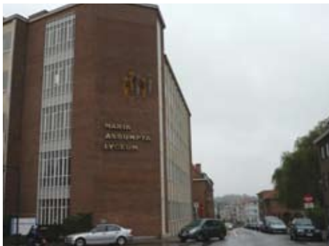
Het KK Assumpta te Laken aan het kruispunt van de Paul Jansonstraat en de Romeinsesteenweg.