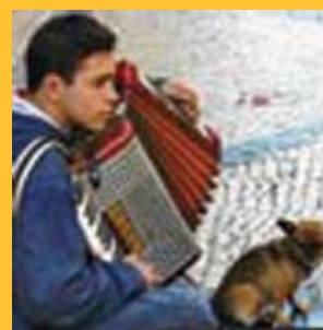
Examen voor straatmuzikanten; overregulering van de bovenste plank.

Wist je dat de Stad Brussel in mei het examen voor straatmuzikanten invoerde? Straatmuzikanten krijgen vanaf nu een vergunning indien ze een artistiek diploma hebben of ze een positief examen voor een jury afleggen. 'Een bedelaar mag zonder vergunning geld vragen om niets te doen, maar een straatmuzikant heeft een diploma nodig of hij kan de straat niet op. Dat is de wereld op z'n kop.' aldus Ampe.