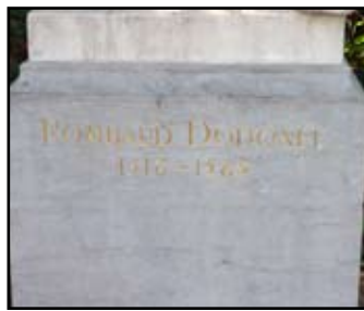
Rombaud Dodonee alias Rembert Dodoens.