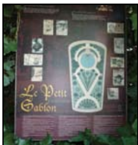
Het enige infobord: achteraan verstopt in de struiken.