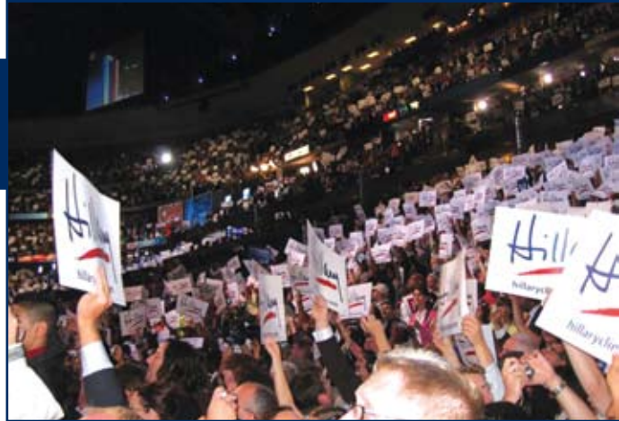
De Democratische Conventie in beeld

Op gebied van aandacht voor groene problematieken en groene acties zijn ze ons echter al ver voor. "Save the planet" is dé slagzin. Het commercialiseren van groene energie (vooral zonne- en windenergie) is volop aan de gang. De autobussen van het openbaar vervoer rijden op biodiesel of zijn hybride voertuigen.