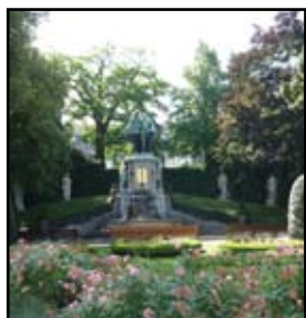
De pittoreske Kleine Zavel.

Dit maal geen verouderde stadsplannen, wel het ontbreken van Nederlandse vertalingen in het parkje van de Kleine Zavel. De Kleine Zavel is een prachtig stukje groen midden in de stad, dat we te danken hebben aan oud-burgemeester Karel Buls. Toch is niet alles peis en vree in deze groene oase. Het eerste probleem is de afwezigheid van Nederlandse vertalingen op de 10 beelden van prominente figuren uit de geschiedenis van de Nederlanden. De 10 heren, onder wie Willem van Oranje en Gerard Mercator, worden in vergulde letters