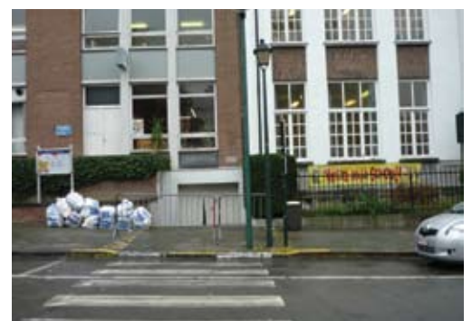
Een zebraapad vlak voor de schoolpoort kan niet. Dranghekkken zorgen voorlopig voor de veiligheid van de kinderen.