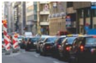
Verkeersfiles in de Brusselse straten

is veelal geen optie meer, gezien de weinige parkeerplaatsen snel bezet zijn. Dus verplicht de stad ons onrechtstreeks om een parking te gaan huren. Dit kost al snel 125 € per maand. Indien we willen gaan winkelen dienen we