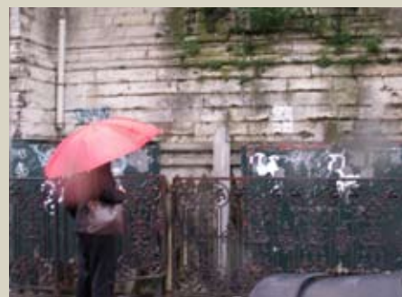
'Openbare toiletten' in centrum Brussel

In het Proper Brussel-dossier doen Els Ampe en Carla Dejonghe een aantal concrete voorstellen die de ambitie hebben bij te dragen aan een effectiever beleid om de stad en haar imago proper te houden.